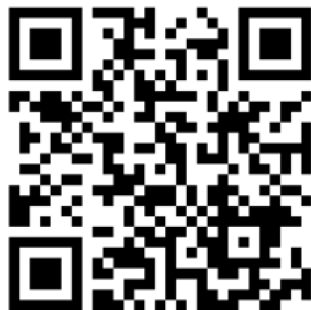
インタビュー動画2