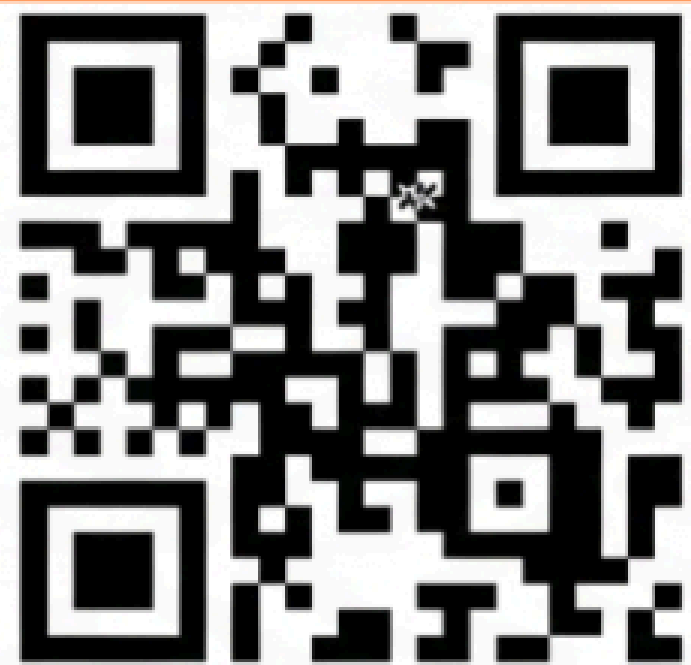
インタビュー動画1